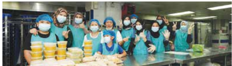
Pasukan Food Warriors KWAP yang terdiri daripada sukarelawan KWAP CYCLE telah menyalursemula lebih makanan semasa KWAP Inspire Conference 2024 , dengan kerjasama What-a-Waste (WaW)