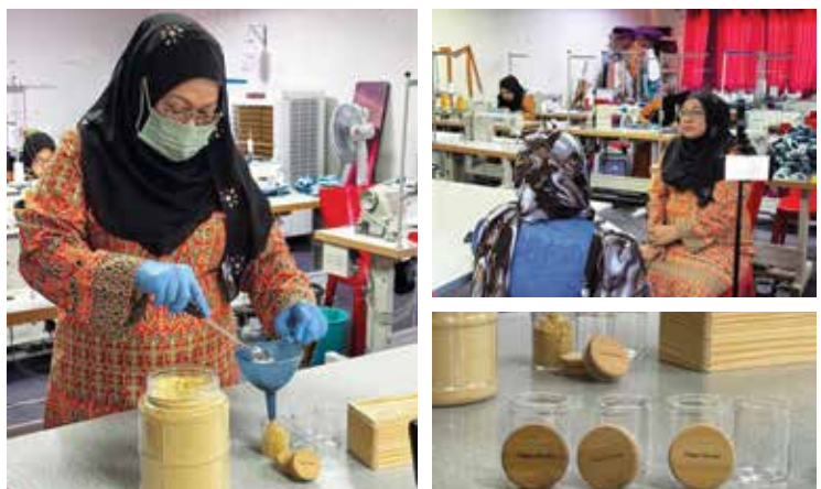
Women of Will telah menghasilkan barangan kitar semula kreatif daripada kain linen hotel terpakai serta balang kaca kitar semula yang diisi dengan rempah ratus tempatan untuk Persidangan KWAP Inspire 2024, dalam usaha memperkasakan golongan ibu tunggal dari PPR Lembah Subang