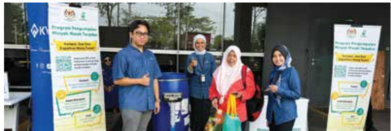
Pengumpulan Minyak Masak Terpakai (UCO) yang disertai oleh pesara di KWAP Cyberjaya sempena Bulan Kitaran KWAP 2024